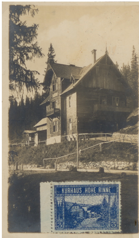
Fig. 6. Sanatoriul Militar (inugurat la 10 iulie 1898).

Sanatoriul Militar și-a datorat apariția la Păltiniș unei asociații a ofițerilor special înființată în acest scop, ‘Asociația pentru edificarea unui Sanatoriu Militar’, clădirea nefiind deci o proprietate a armatei austro-ungare. Corpul ofițerilor și funcționarilor militari din Ardeal a fost un promotor al înființării stabilimentului balnear propriu la Hohe Rinne, inclusiv prin vocea autorizată a comandantului său, Theodor von Galcozcy 11 .