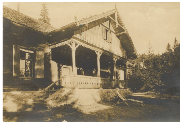
Fig. 5. Căminul Medicilor (inaugurat la 12 iunie 1898).

În 1896 a început extinderea Păltinișului 9 , prin apariția unor construcții care nu mai erau tutelate de S.K.V. S-a început ridicarea unei cabane numită 'Căminul Medicilor' (în limba germană 'Ärzteheim') și s-au definitivat planurile pentru construcția unui Sanatoriu Militar. Ambele clădiri au fost date în folosință la începutul verii lui 1898, remarcându-se printr-un aspect pe deplin concordant cu arhitectura clădirilor anterioare ridicate la Păltiniș de către S.K.V.