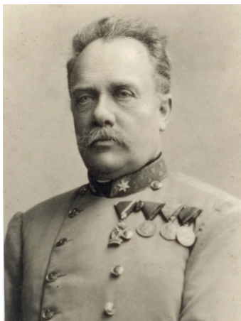
Fig. 1. G-ral dr. Julius Pildner von Steinburg († 1917).

Inițiativa înființării unei stațiuni climaterice în munții din preajma Sibiului a fost lansată public de către un medic, membru proeminent al Asociației Carpatine din Ardeal (Siebenburgischer Karpathen-Verein, S.K.V.), doctorul militar Julius Pildner von Steinburg 1 (Fig. 1).