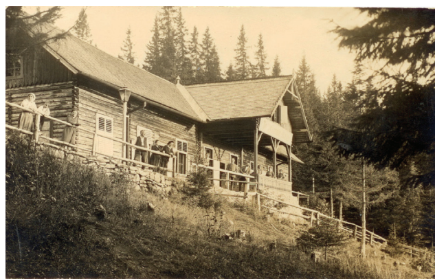
Fig. 4. Casa Turiștilor (construită în 1895, extinsă în 1902).